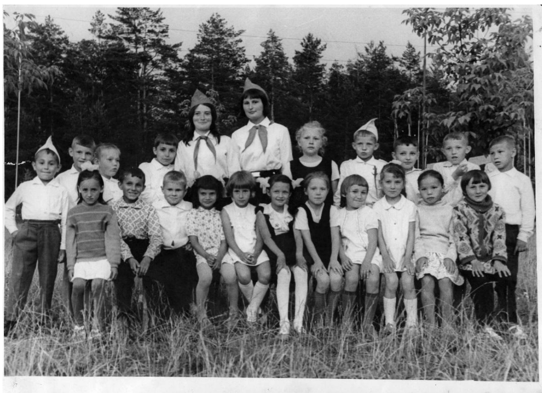
1973 ел. Казанның “Молодая гвардия” лагерында пионервожатый булып эшлэгән еллар.