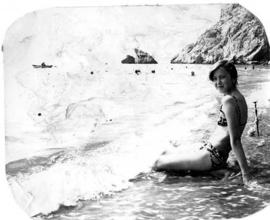
Биредә ел әйләнәсе — кояш, яшеллек, дингез...