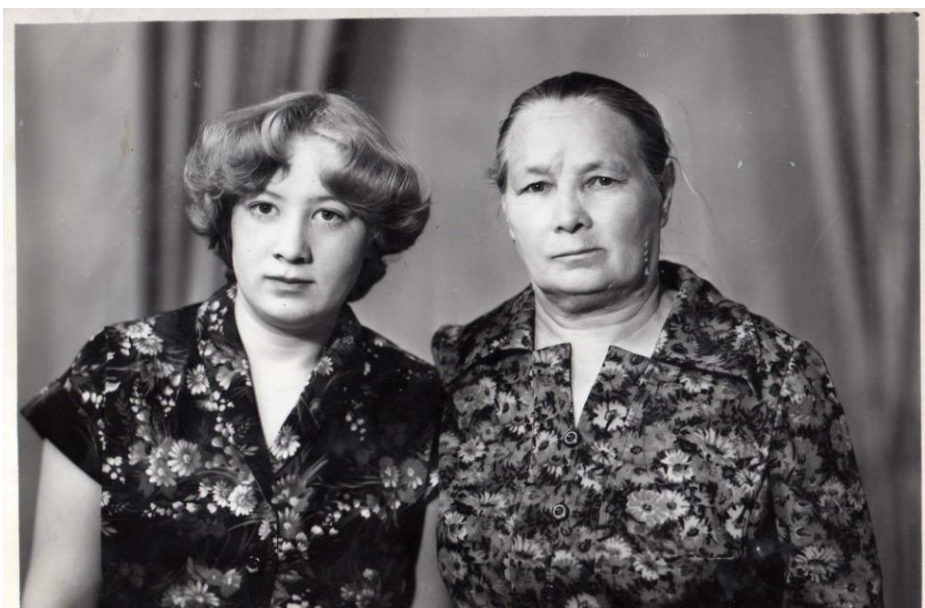
Саимә апа кызы белән. 1981 ел