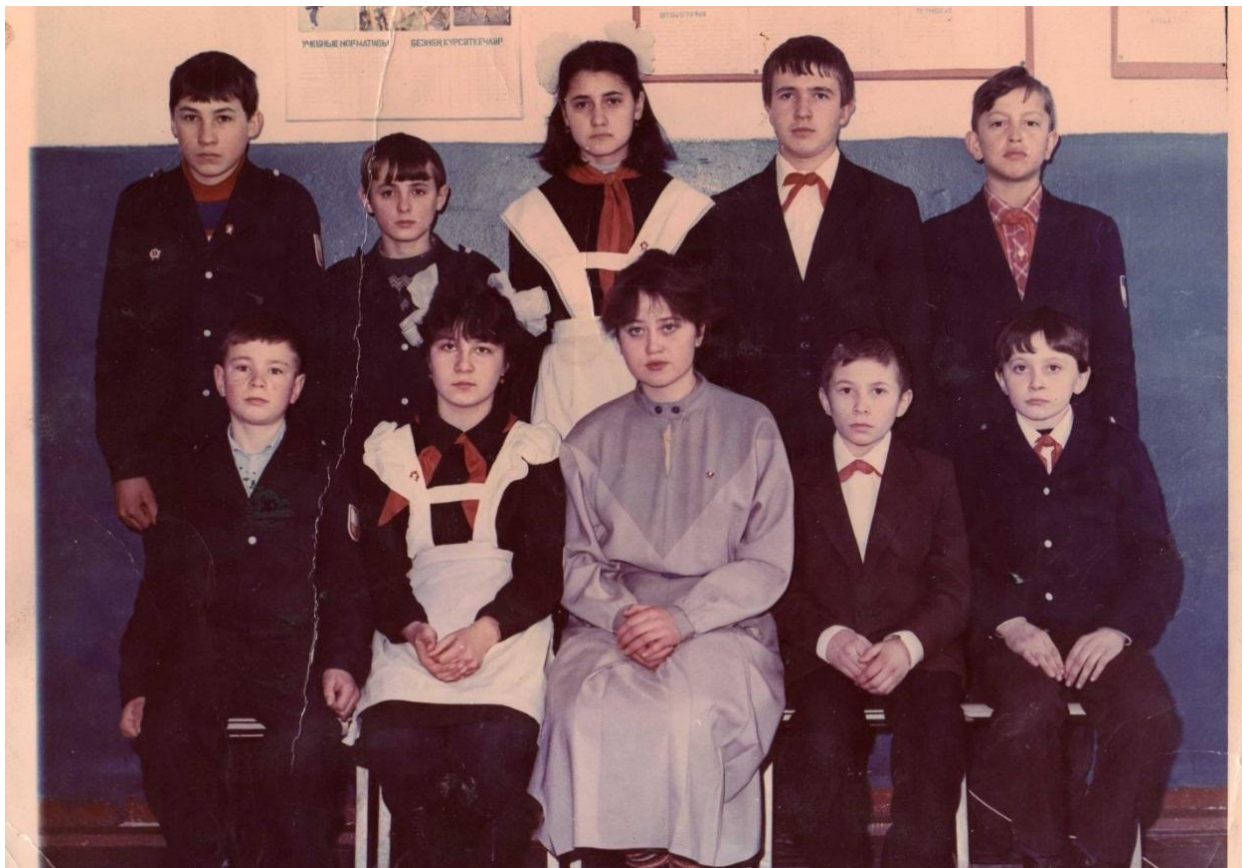
Минем беренче укучыларым