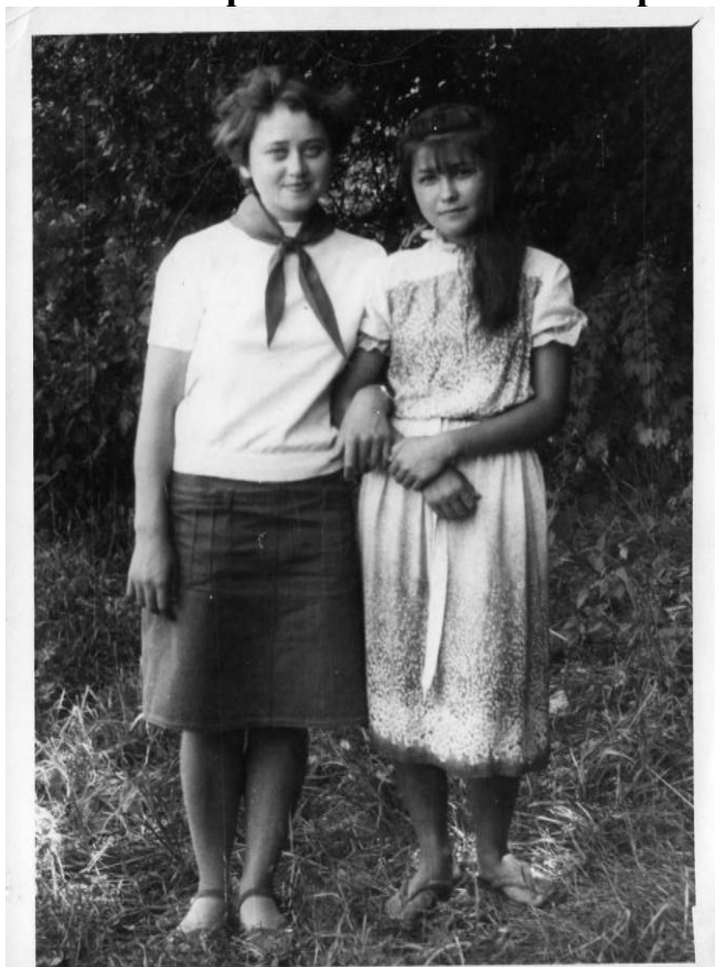
Пионервожаты булып эшлэгән еллар бик тә сагындыра