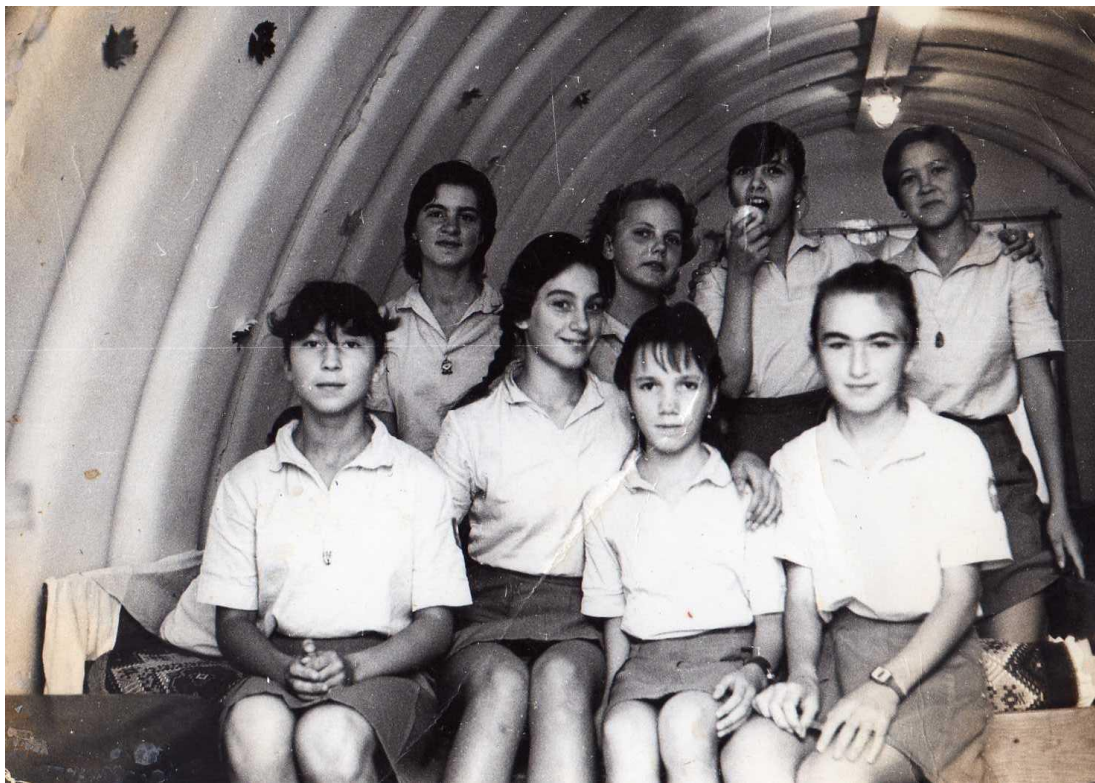
“Артек” балачакның иң гүзэл бер хатирәсе булып күнелдә саклана.