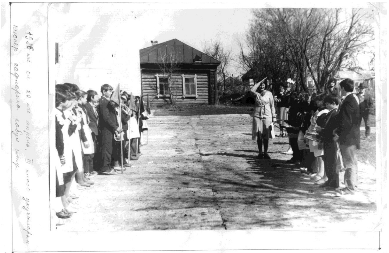
Айга бер тапкыр актив укуы алып барыла иде. Аны дружина советы председателе житэкли иде.