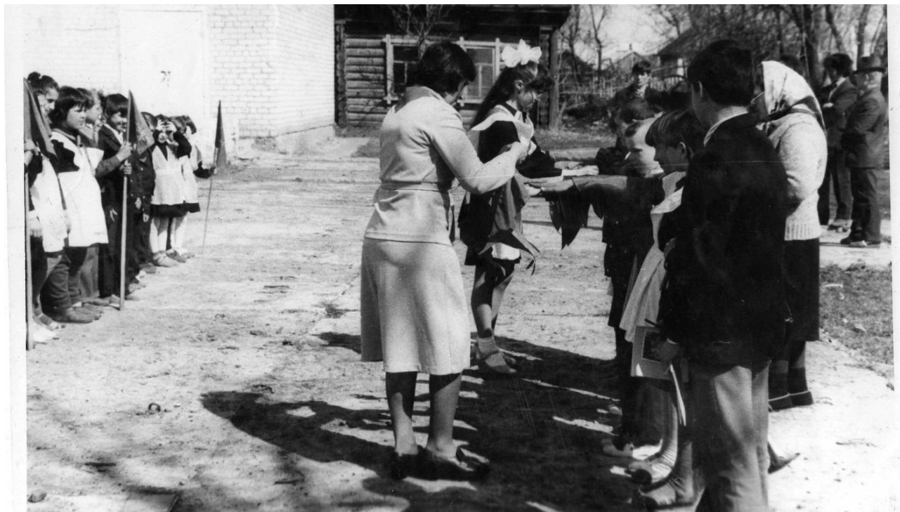
1986 ел. 3 нче сыйныф укучыларын пионерга кабул итү сборы.