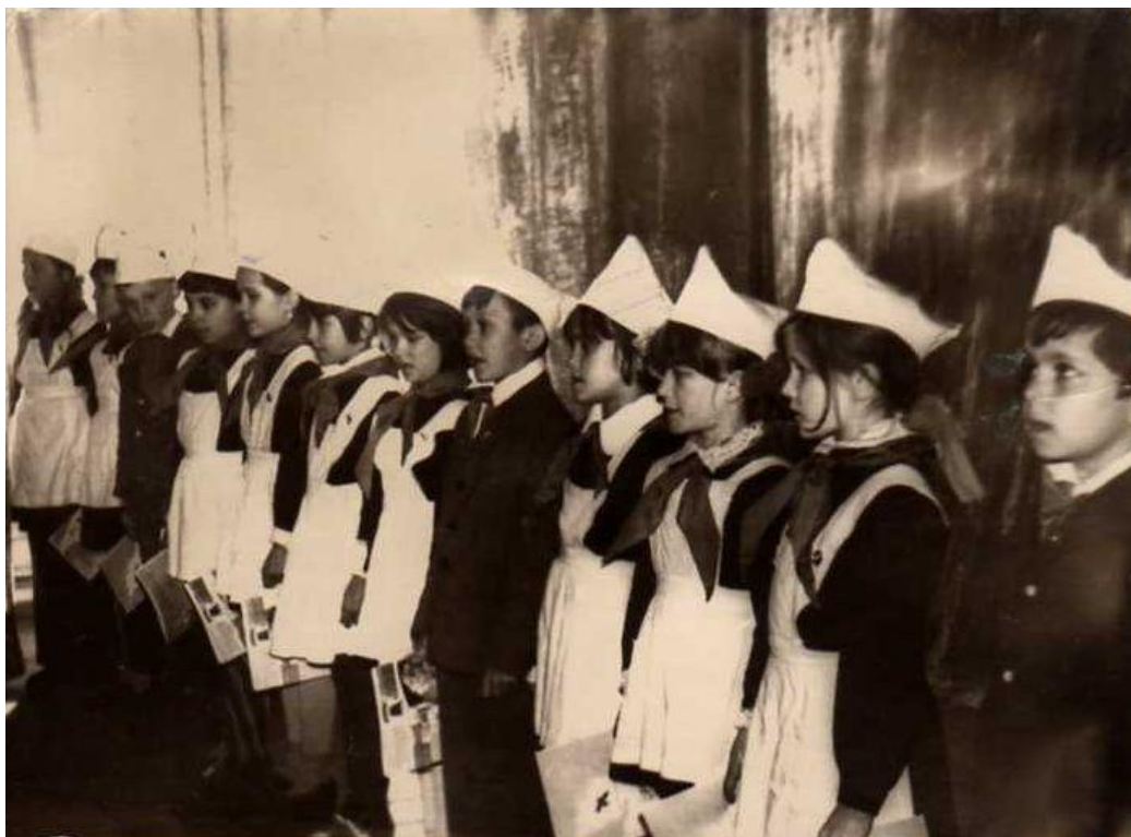
1977 ел. 22 апрель. 3 нче сыйныф укучылары пионер булдылар.

Шатлыгыбызны күрсеннәр диеп, Бәтен урамны шаулатып йөрдек. Иң истәлеке көнебез бүген- Без пионерга кабул ителдек. Инде без зурлар, без- пионерлар!