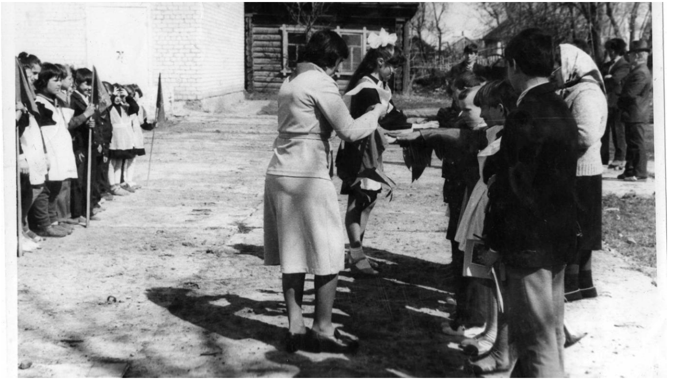
1936 аи ээ ние амьтан. Үү ние кууааг гэгээн- үлэйн нүүрэг сарууланга кабыл ний. Төмөнг нийг баарман.