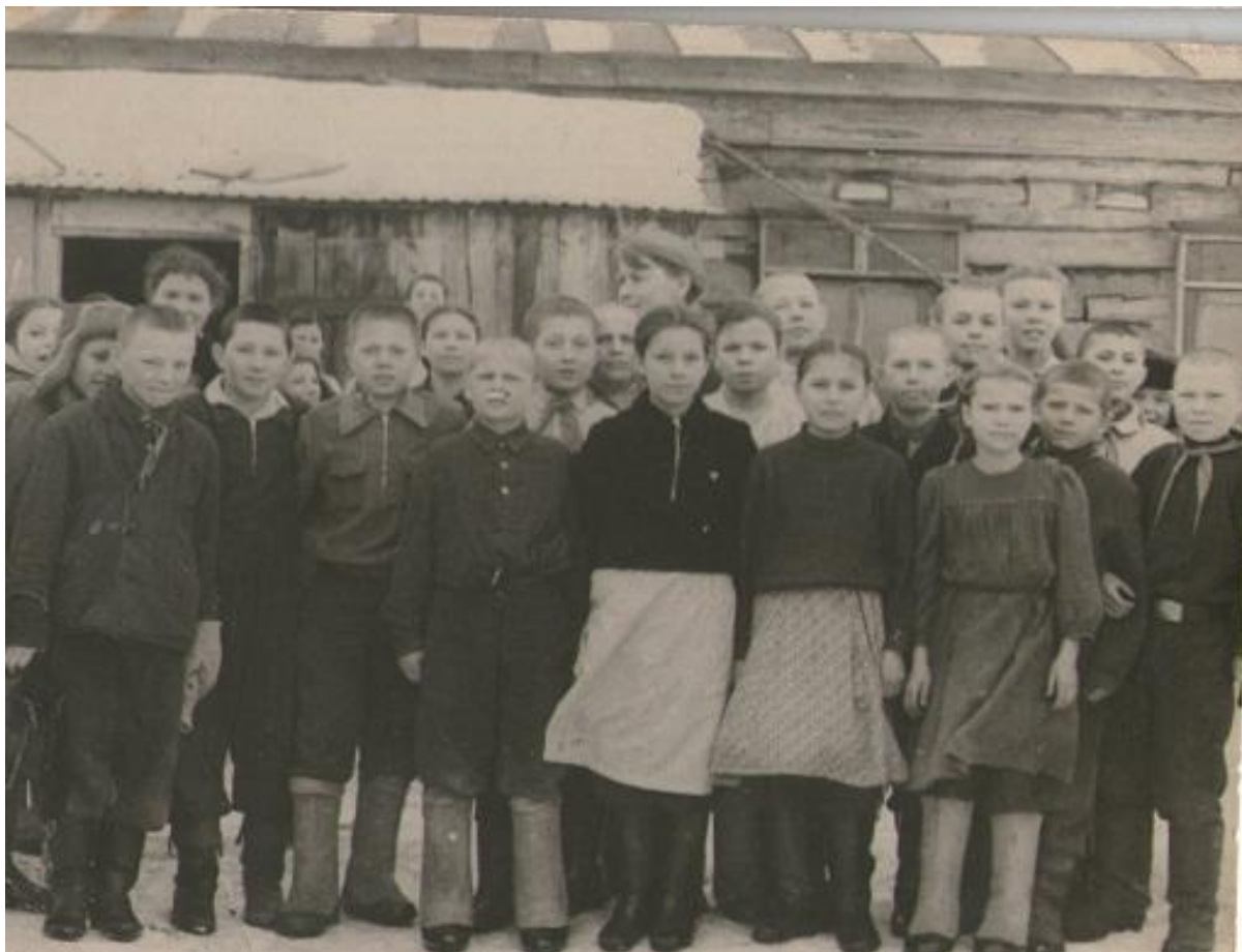
1962 нче еллар. Пионерлар һәм комсомоллар

(әби-бабайларның, эти-эниләрнең, укытучыларның шәхси архивынан истәлекләр)