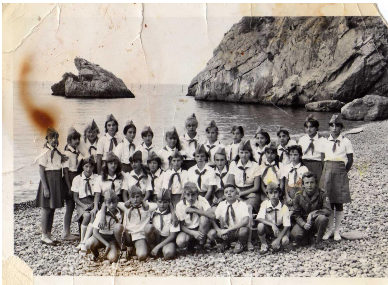
Лагерь дөнъяның жәннәткә тиң бер почмагына — Кара дингез буена, Аюдаг итәгенә урнашкан.