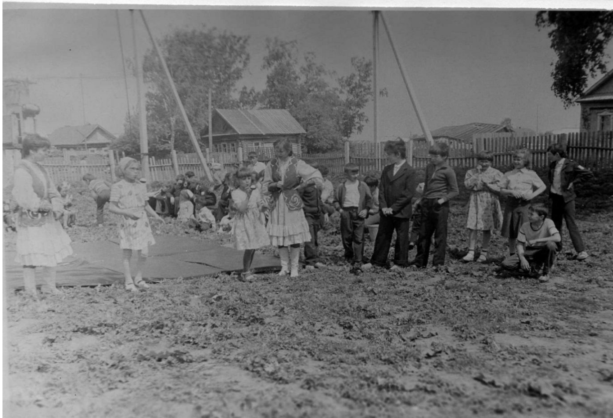
1989 ел. Пионер сабан туеннан күренешләр. Ягез, кем өлгөр, кем житез?